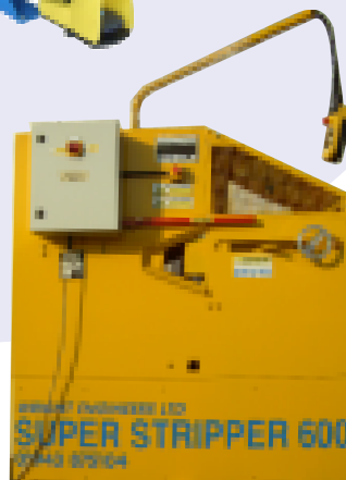
Super Stripper 600